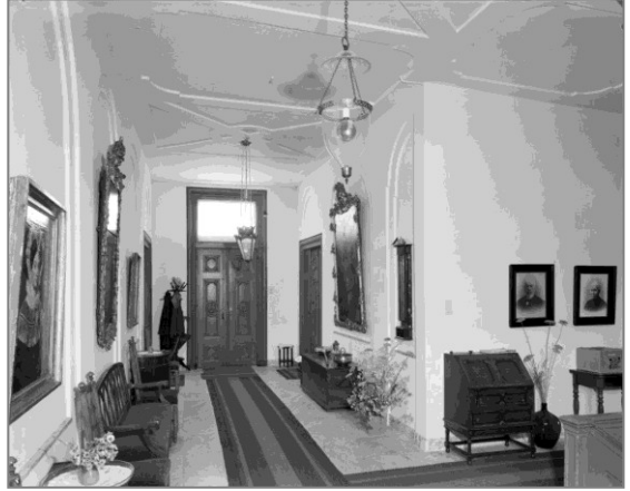
Archieffoto's van de hall van Schatzenburg, met het schilderij op dezelfde plaats als die waar hij nu weer hangt.