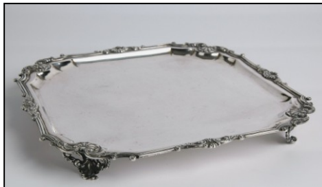
Het zilveren cabaret